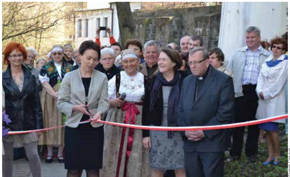
Uliczką Cieszyńskich Kobiet, która wzbogaciła się ostatnio o nowe pomniki-lampy, można spacerować na Wzgórzu Zamkowym.