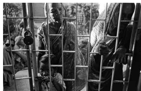
Trędowaci z indyjskiej wioski Puri są bohaterami zdjęć na wystawie w COK.

Jakub Śliwa – absolwent Filologii Orientalnej UJ i Szkoły Filmowej w Łodzi. Jego zdjęcia ukazują się w albumach oraz publikacjach naukowych w kraju i na świecie. Współpracuje z wydawnictwami oraz agencjami reklamowymi. Publikuje w polskiej i zagranicznej prasie (m.in. w polskiej edycji National Geographic, The Guardian). Uczestniczył w międzynarodowych festiwalach fotografii (m.in. Fotofestiwal Łódź, Kaunas Photo Days, Festival of the Photograph w Charlottesville). Zajmuje się też dokumentacją fotograficzną wykopalisk archeologicznych oraz konserwacją dzieł sztuki. W 2006 r. zdobył nagrodę w Press Photo za reportaż w kategorii „Społeczeń-