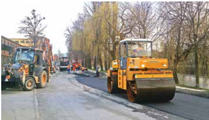
Ruszyły prace remontowe na Al. Łyska.

W ubiegłym tygodniu zaczęto długooczekiwane odtwarzanie nawierzchni Al. Łyska (końcowe i wstępne) na odcinku między Mostem Przyjaźni i Wolności. Wykonawca planuje przystąpienie w najbliższym czasie do robót odtworzeniowych (asfaltowanie) na ul. Ignacego Kraszewskiego, Karola Miarki a następnie Jana Matejki.