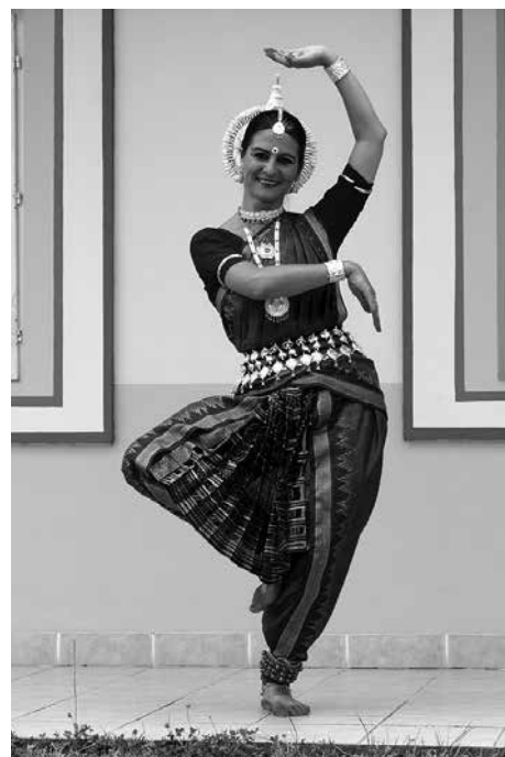
Na warsztaty klasycznego tańca indyjskiego zapraszamy 11 maja.