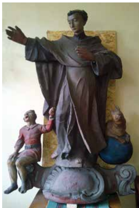
Tak wygląda figura św. Antoniego Pustelnika, pochodząca prawdopodobnie z XVIII w.

Podczas rutynowych prac remontowych prowadzonych przez pracowników Zakładu Budynków Miejskich postanowiono zadbać o kapliczkę naścienną, zamontowaną przed laty w ścianie jednej z kamieniczek przy ul. Zamkowej. We wnętrzu kapliczki znajdowała się drewniana figura.