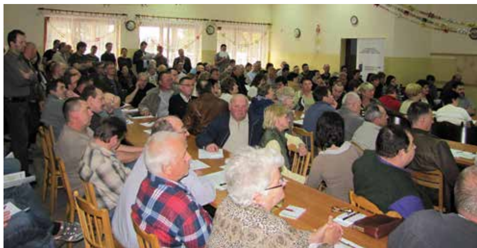
Na spotkaniu z Burmistrzem mieszkańcy Cieszyna otrzymali warunki techniczne, które określają zasady podłączenia się do nowej sieci kanalizacyjnej.