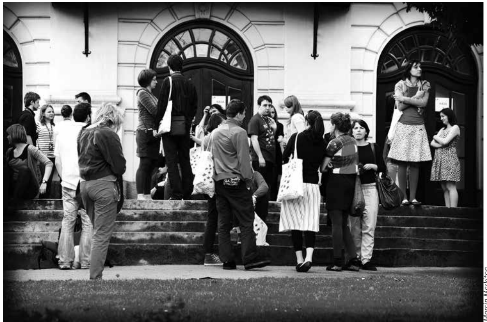
Podczas Kina na Granicy można zobaczyć wiele bardzo dobrych, polskich, czeskich, słowackich i węgierskich filmów.