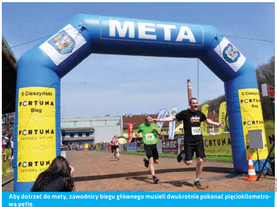
Aby dotrzeć do mety, zawodnicy biegu głównego musieli dwukrotnie pokonać pięciokilometrową pętlę.