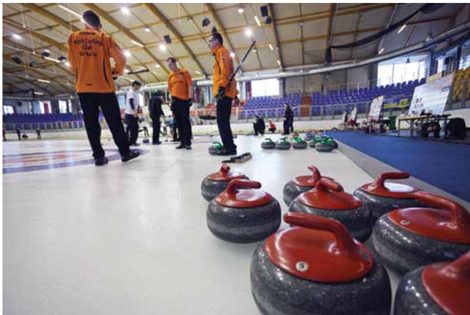
Cieszyn był gospodarzem IV edycji międzynarodowego turnieju curlingowego „Silesian Grand Prix”.

W tym roku młode polskie zespoły stanęły na wysokości zadania i sprawiły zarówno uczestnikom, jak i kibicom miłą niespodziankę. POS Łódź i Axel Toruń spotkały się w finale, który zakończył się zwycięstwem