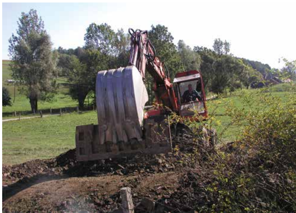
Szacuje się, że z wybudowanych ponad 25 km kanalizacji w Krasnej będzie korzystać ok. 950 osób.

ślańskiej, Spółdzielczej, Kępnej, Wielodroga, Braci Miłosiernych, Słowiczej, Ustrońskiej. W ramach zadania wybudowano ponad 25 km kanalizacji sanitarnej. Szacuje się, że z kanalizacji sanitarnej w Krasnej będzie korzystać około 950 osób.