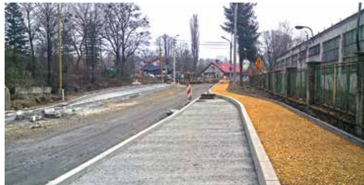
Trwa budowa mostu nad Puńcówką, który powinien być gotowy do końca maja.

W ciągu Al. Łyska, w rejonie dawnej kręgielni realizowana jest przez Powiat inwestycja: budowa mostu nad Puńcówką (Cieszyn współfinansuje budowę w wysokości 100 000 zł). Z ostatnich zapewnień Wykonawcy wynika, iż inwestycja (nowy most i fragmenty dróg: Al. Łyska, Błogockiej, Żeromskiego) będzie gotowa do końca maja br. Odcinek między ul. B. Kantora a wjazdem do dawnej fabryki LAS jest w tej chwili projektowany – niestety remont (wraz z budową mostu nad Młynówką) nastąpi w terminie późniejszym.