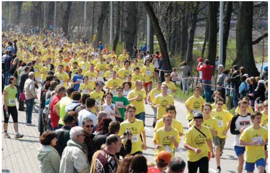
W biegu młodzieżowym pobity został ubiegłoroczny rekord frekwencji - wystartowało blisko 850 biegaczy.